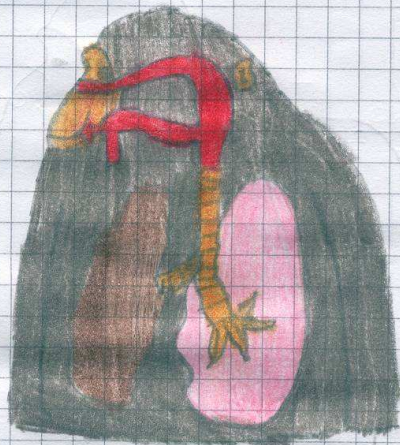
Scimmia o Gorilla

Alcuni animali, come l'uomo, respirano con i POLMONI