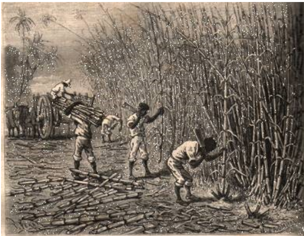
Exemple d'agricultura tradicional

Aquest sistema econòmic fou substituït per un altre destinat a l'exportació, en règim de monocultiu, el qual va provocar la desaparició de les formes ancestrals de producció i l'extensió de cultius com el del cafè, cacau, cautxú te o canya de sucre. Àmplies zones van ser rompudes per a ser adaptades a les noves exigències econòmiques, donant lloc a notables canvis del paisatge i greus alteracions del medi natural.