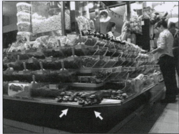
Fig. 3.—Puesto de productos dulces y frutos seco en un centro comercial. En un primer plano se aprecian camiones de juguete (flechas blancas) que contienen estos productos (los camiones sirven de "envase"). Adquirir y consumir "dulces" resulta agradable porque proporciona placer, a cualquier hora (i.e. el helado, un producto estacional del verano, se consume ahora durante todo el año).

Hasta el momento, las intervenciones que se han efectuado en el ámbito de la educación sanitaria han sido de carácter aislado y con resultados modestos. Una de las posibles razones que pueden justificar este fracaso, es que los principales determinantes para que la población modifique sus hábitos alimenticios e incrementemente la actividad física no son educacionales, sino