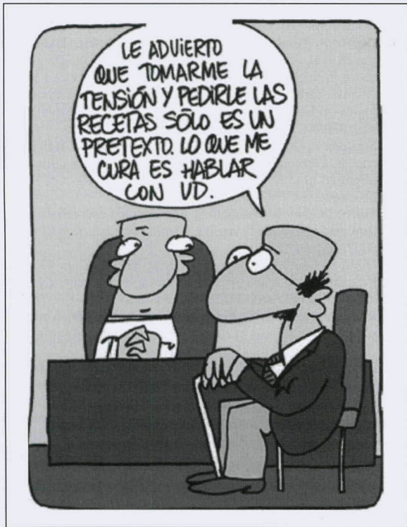
Fig. 2.—Viñeta del humorista Summers que refleja cómo en el sector de los servicios personalizados (i.e. consultas médicas), el nivel de satisfacción está en relación con el tiempo invertido en escuchar, comprender y formular recomendaciones.

recomendaciones actualmente vigentes de consumo de los distintos grupos de alimentos en el contexto de una alimentación equilibrada y saludable, para de ese modo evitar las posibles desviaciones que pudieran conllevar potenciales efectos negativos para la salud.