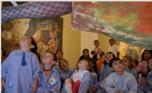
Material realizado por el equipo educativo de Malba

Juanito Laguna es un personaje creado por Antonio Berni para denunciar la pobreza y la difícil situación que viven los niños de la calle. A partir de las obras de la serie de Juanito Laguna, se puede proponer a los chicos que compongan una historia en conjunto inspirada en este personaje. Un cuento estimula la creatividad y permite desarrollar la estructura narrativa.