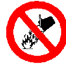
Prohibido apagar con agua