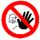
Entrada prohibida a personas no autorizadas