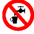
Agua no potable