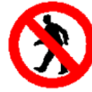
Prohibido pasar a los peatones