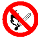
Prohibido fumar y encender fuego