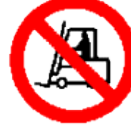
Prohibido a los vehículos de manutención