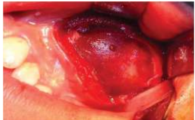
Figura 4. Lecho quirúrgico, tumoración bien delimitada, cubierta por una delgada membrana grisácea, indurada dentro del seno maxilar.

Se reporta como resultado histopatológico una; lesión de estirpe odontogénico formada por una gruesa pared de tejido fibroso laxo bien vascularizada, con zona de hemorragia reciente y antigua, revestida en