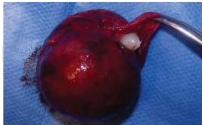
Figura 5. Lesión delimitada, con presencia de canino permanente en su interior, de aproximadamente 4 x 4 cm.