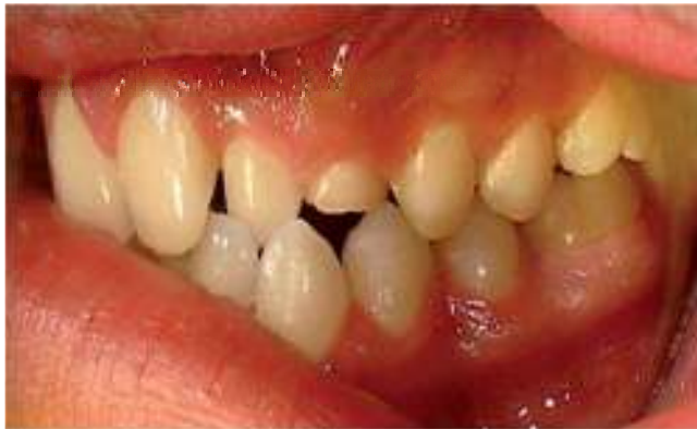
Figura 2. Ausencia de canino permanente, aumento de volumen, sin datos de infección.

Mediante anestesia general inhalatoria balanceada, con intubación oro traqueal, previa asepsia y antisepsia de la región facial con yodopovidona, previa colocación de taponamiento faríngeo y campos estériles, se infiltra xilocaína con epinefrina al 2% a nivel de nervio infraorbitario izquierdo, se realiza incisión semilunar, apical a los dientes 22, 63, 24, 25 con hoja de bisturí 15, se desperiostiza, obteniéndose colgajo mucoperióstico observándose pared anterior de seno maxilar sin perforación, sólo adelgazamiento de la cortical vestibular, por lo que se realiza osteotomías para exponerse la tumoración ( Figura 4 ); el cual se palpa de consistencia firme, no desplazable, bien delimitada, ocupando el seno maxilar en su totalidad;