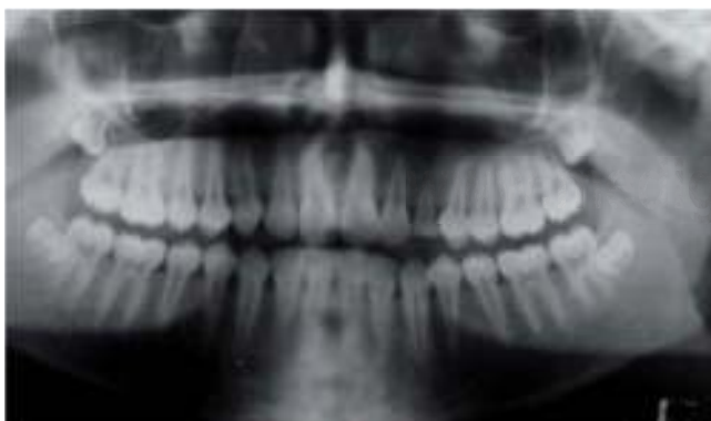
Figura 7. Ortopantomografía postoperatoria un año, tres meses, neumatización normal del seno maxilar, canino decíduo en posición y función, sin datos de recidivas.