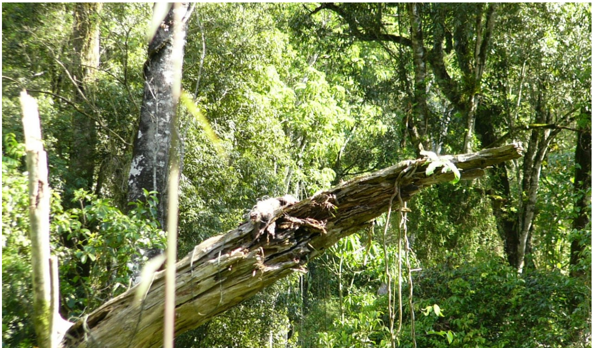
Figura 3. Una de las comadrejas picazas colocadas con una trampa, sobre una rama ubicada en las proximidades del nido.