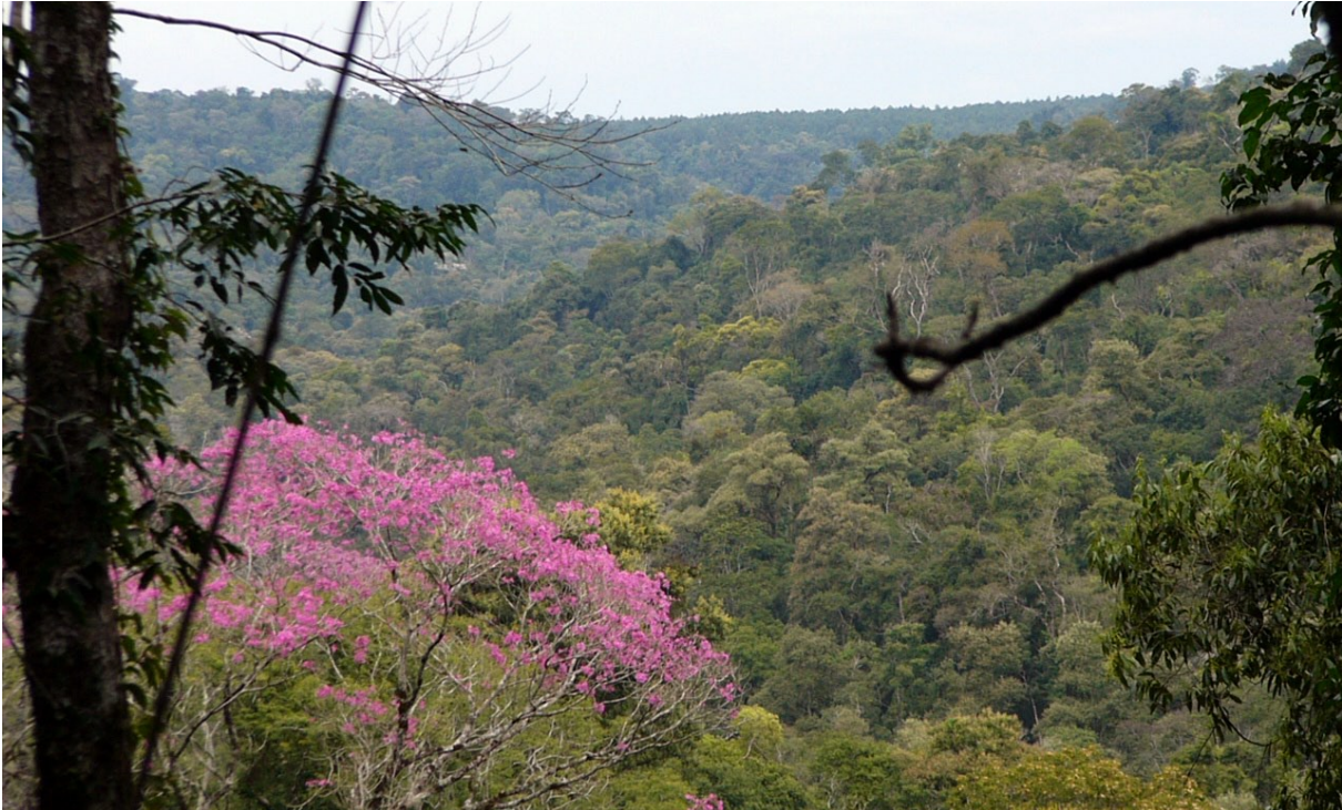
Figura 1. Vista panorámica del ambiente selvático en buen estado de conservación presente en el valle del arroyo Juanita (Dpto. Gral. Manuel Belgrano), tomada desde el pie del timbó que sostiene el nido de harpía. Ver ítem descripción del área de estudio.

dendron riedelianum ), el palo rosa ( Aspidosperma polyneuron ), el lapacho negro ( Tabebuia heptaphylla ), entre otras. Otros elementos importantes de este ambiente son las palmeras, destacándose la común palma pindó ( Syagrus romanzoffianum ) y el palmito ( Euterpe edulis ), además de abundantes cañaverales, helechos y numerosas hierbas umbrófilas, lianas y epífitas. Fitogeográficamente el sector correspondería a las selvas de laurel, guatambú, palo rosa y palmito características del norte misionero (Cabrera, 1976).