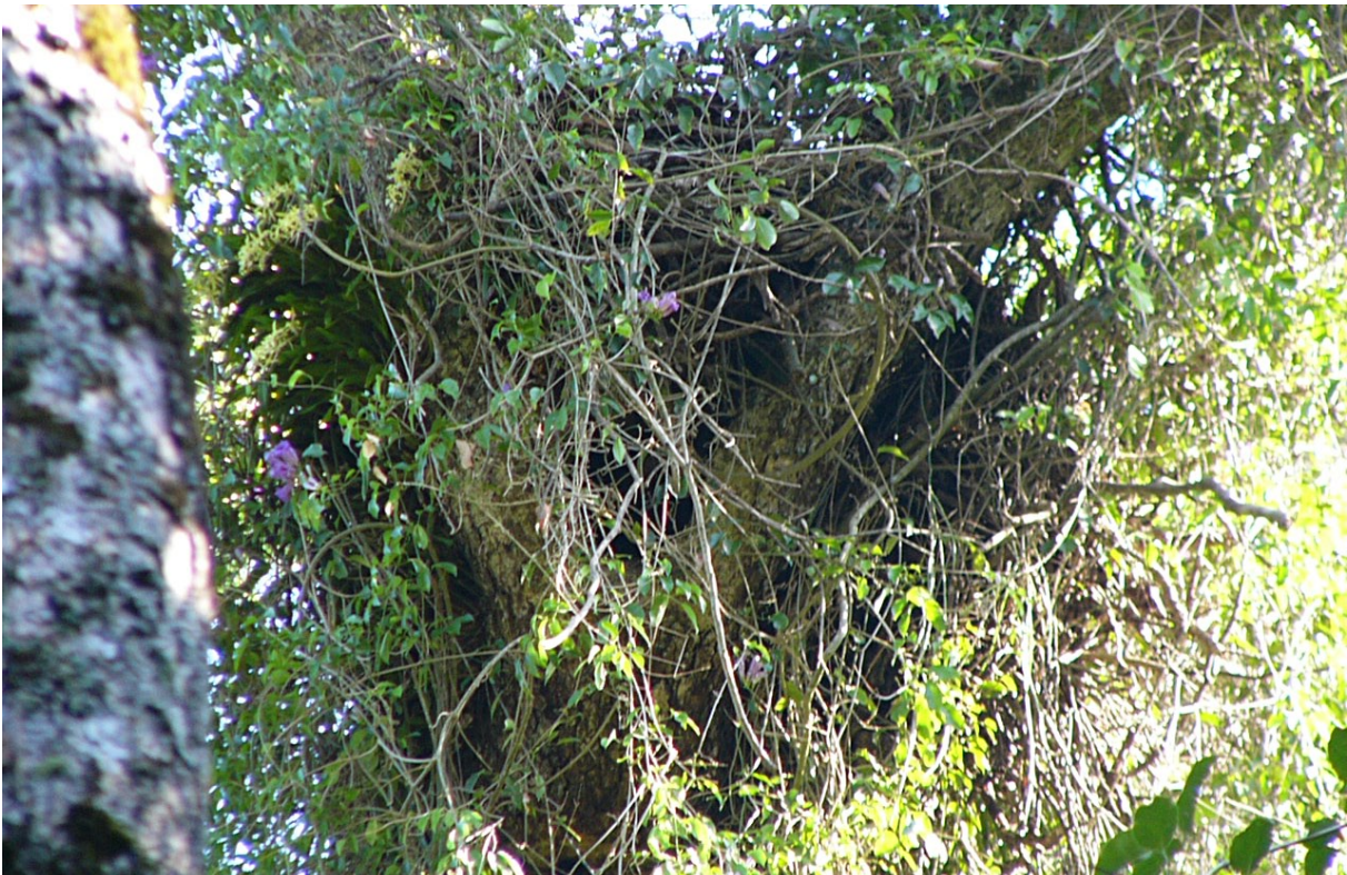
Figura 10. Otra vista en primer plano de la gran acumulación de ramas que constituye su nido. La altura del mismo fue calculada en un metro y se estima por su buen estado de conservación que podría haber sido utilizado por la pareja en más de una nidada.