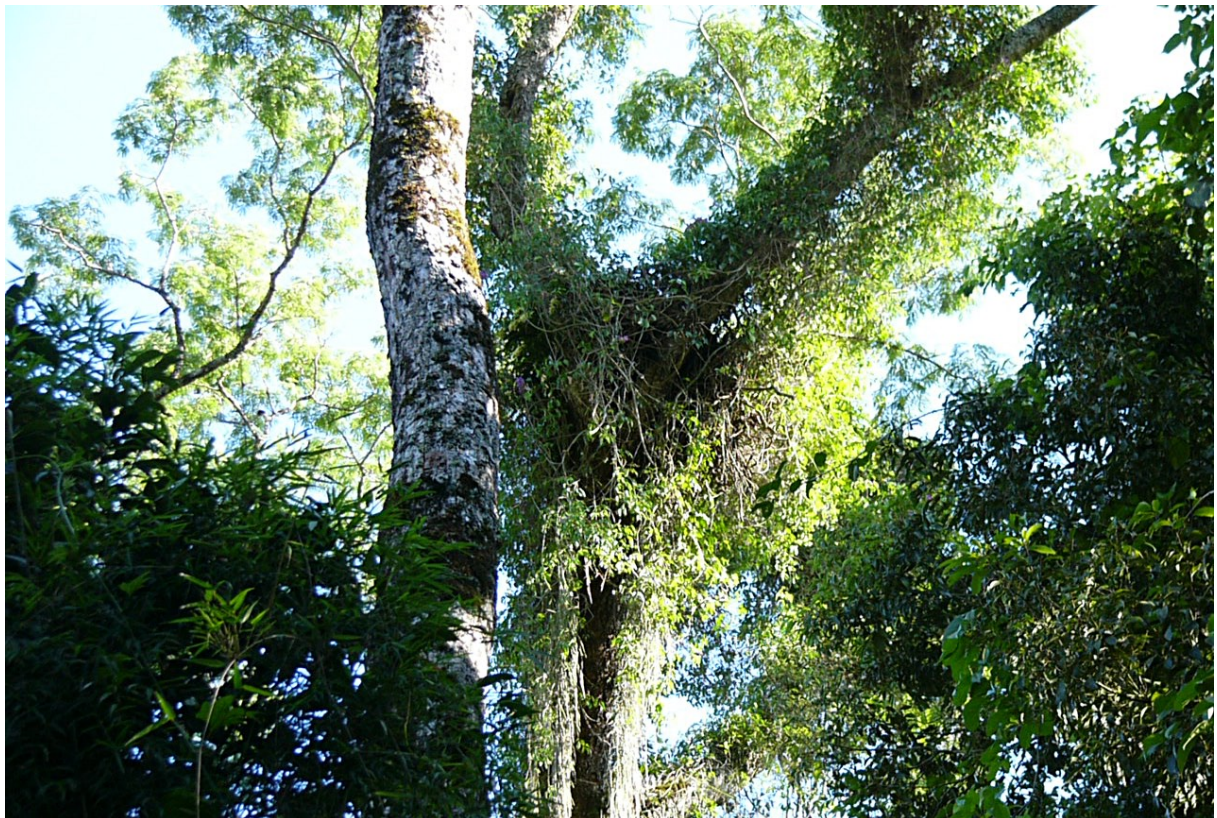
Figura 8. Foto más en detalle del nido, tomada desde el lado norte. Nótese las abundantes lianas y epifitas que lo recubren.