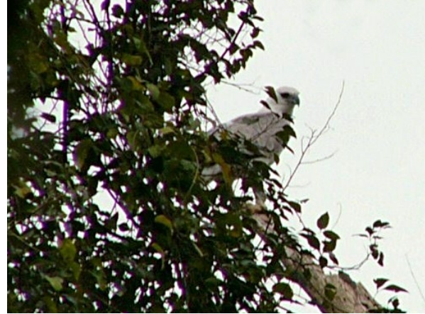
Figura 5. Retrato en primer plano del juvenil en una postura erguida, tomada desde el arroyo Juanita.