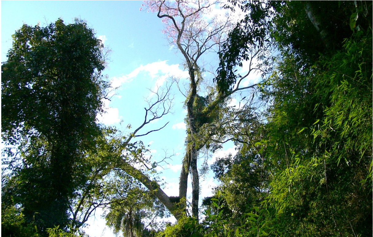
Figura 7. Vista del árbol que sostiene el nido, tomada desde el lado sur. Obsérvese que a diferencia de otros nidos hallados, éste no se encontraba ubicado en la bifurcación principal del tronco con las ramas, sino que estaba asentado en un gran gajo de más de un metro de diámetro donde había una bifurcación con otra rama.