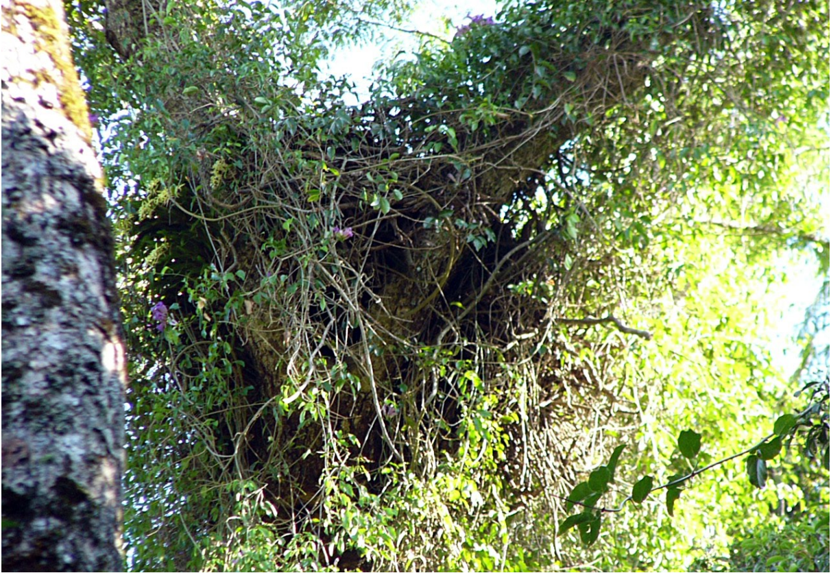
Figura 9. Primer plano del nido, donde se observan densas lianas como el isipó que le sirven de camuflaje.