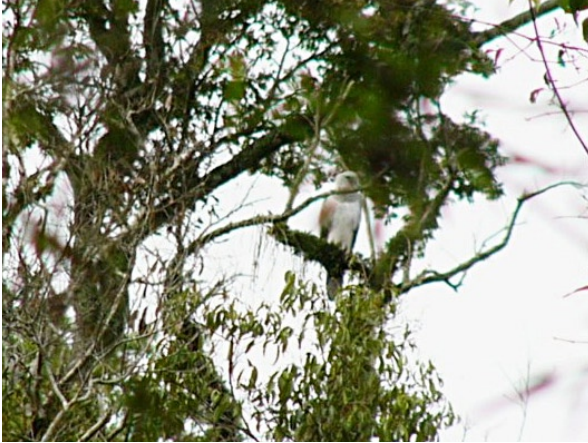
Figura 4. Foto tomada desde el arroyo, en la que se aprecia al juvenil de lejos a mediana altura, posado sobre una rama baja y recubierta de epífitas. Nótese el babero grisáceo que luce.