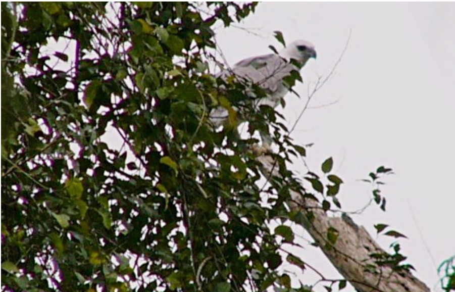
Figura 6. Otra imagen del juvenil, al igual que en la anterior, tomada desde el arroyo.

llado un individuo juvenil volantón de Harpía ( Harpia harpyja ), de aproximadamente 5 meses de edad. Estaba posado en las ramas altas de un cedro seco, donde se mantuvo por cerca de 10 minutos hasta que realizó un corto vuelo para situarse fuera de nuestra vista. Al regresar caminando por el lecho del arroyo, el águila nuevamente nos sobrevoló durante unos segundos y volvió a internarse en el monte. La identificación como volantón de Harpía se realiza gracias a la observación del plumaje, la cresta occipital del individuo y el tamaño de sus patas.