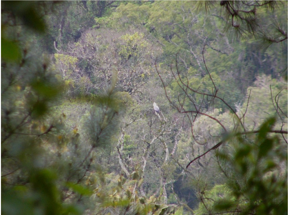
Figura 2. Juvenil sorprendido tomando sol a media tarde. Se observa en primer plano una forestación de pino eliotti.