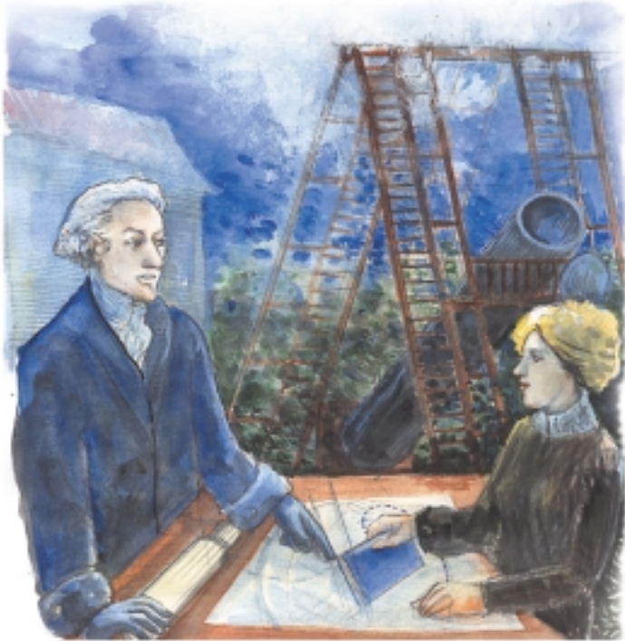
William Herschel y su hermana Carolin fueron grandes observadores del cielo.

Lo nombró Estrella de George como ofrenda a George III , entonces rey de Inglaterra.