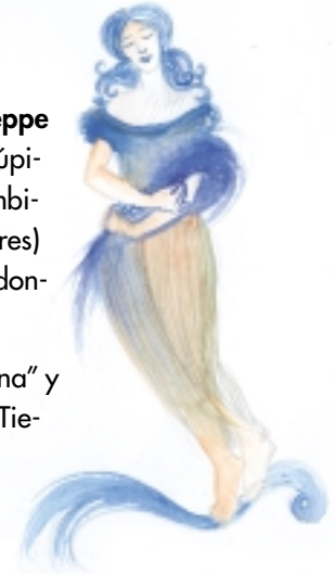
Representación de la diosa Ceres, según un grabado antiguo.

Por la apariencia que presentan al ser fotografiados, semejante a la de las estrellas, los planetitas genéricamente se denominaron asteroides ( aster : estrella y oide : forma) y sus descubridores acordaron en continuar la usanza impuesta por Piazzi y Olbers. Así, la mayoría se denominó con nombres de divinidades femeninas.