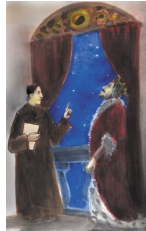
El Padre Piazzi da cuenta del descubrimiento de Ceres Ferdinandea ante el Rey de Sicilia.