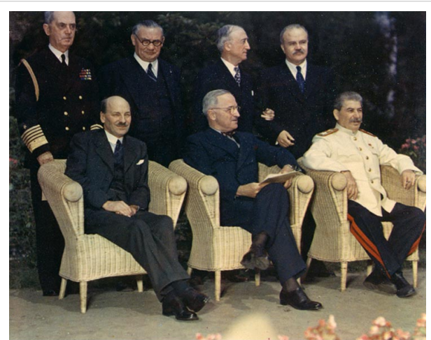
Photo # USA C-1860 "Big Three" & Foreign Ministers at Potsdam, ca. July 1945

Clement Attlee, Harry S. Truman i Stalin durant la conferència.