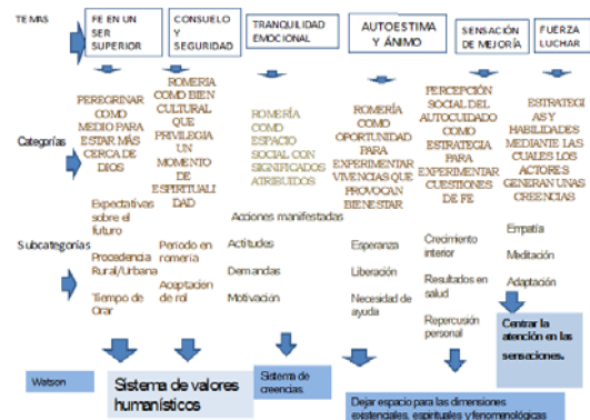
Figura 1 - Exposición esquemática de las categorías finales. Cuidado Bio-Psico-Social-Espiritual

Se incrementaría su estado de bienestar al conocer cómo las personas experimentan e interpretan el mundo social que construyen en su interacción con otros. Muchas situaciones de cuidados que atiende la enfermera, momentos que conllevan ansiedad, preocupación e incertidumbre pueden afrontarse de forma mentalmente muy saludable, que posicionados en el modelo de cuidados de Watson, ayudaría a las personas a mantener, potenciar y reforzar su equilibrio emocional. La realidad está constituida no sólo por hechos observables y externos, sino también por significados, simbólicos e interpretaciones elaboradas