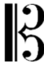
CLAVE DE DO