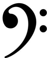
CLAVE DE FA