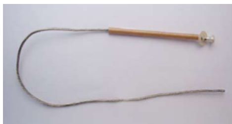
CC Largo 55 cm.

Los hilos fusibles mayores de 100[A] no caben en el desconector de 100 [A].