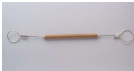
DA Largo 20 cm.