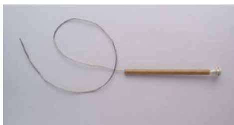
FC Largo 55 cm.