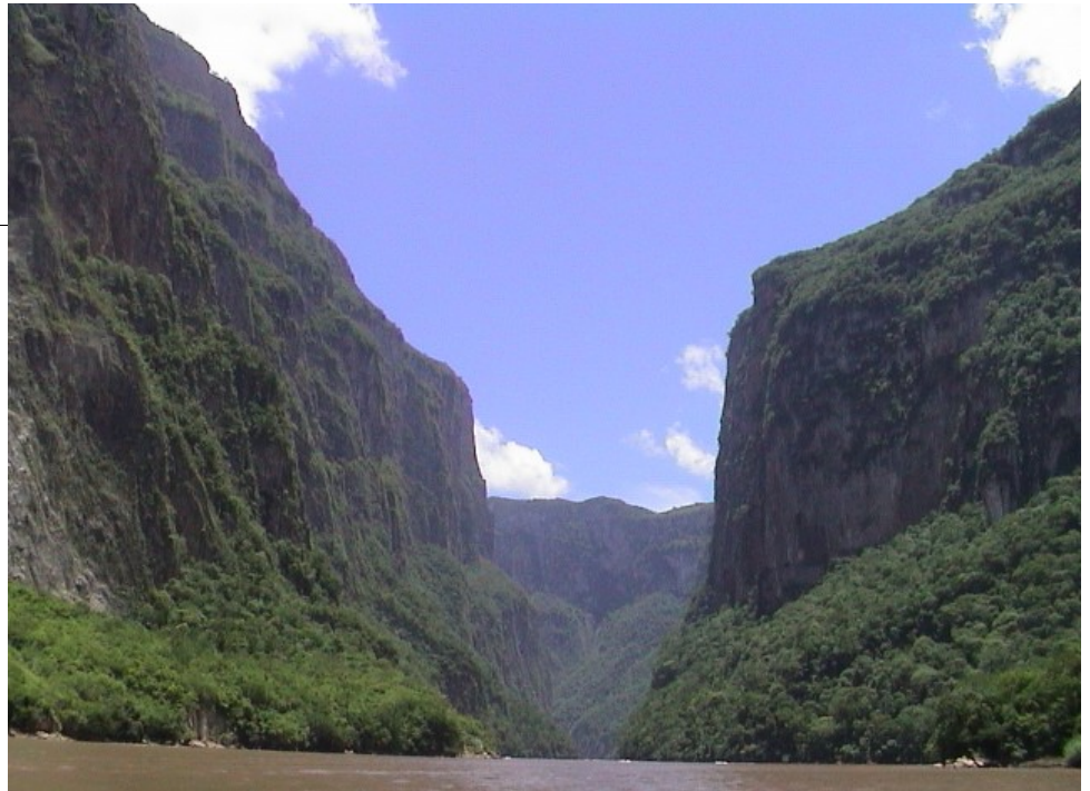
La selva Lacandona, territorio zapatista, uno de los lugares que vió nacer el hacktivismo, el mensaje de los indígenas de Chiapas (Méjico) multiplexado por las redes de internet cuando ésta apenas había empezado a llegar a los hogares de los más afortunados.

PUBLICACIÓN: Publicado originalmente en la revista ARROBA.