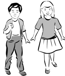
frère ou soeur